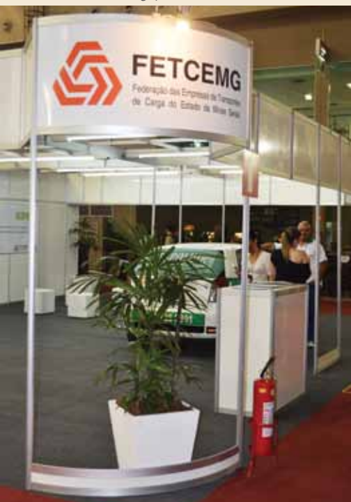
Stand da Fetcemg no evento.