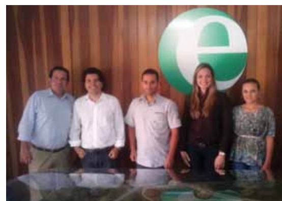
Visita de auditoria à Essencis, em Betim

Durante a visita, os profissionais do sindicato verificaram, in loco , os processos de tratamento dos resíduos, como aterro de classe I e II, a central de coprocessamento e a análise documental das licenças ambientais da Essencis. As visitas estão sendo feitas com indicação das associadas, e essa foi a primeira de outras que irão acontecer.