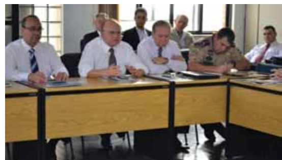
6º Encontro de Segurança Logística, realizado na capital

A delegacia atua em parceria com os sindicatos de transportes de carga para melhoria da segurança, atuando na investigação dos casos e apreensão das quadrilhas. “Estabelecemos uma parceria público-privada com a Fetcemg e o Setcemg, oferecendo todo o respaldo necessário às transportadoras. Atuamos juntos para garantir que esses números