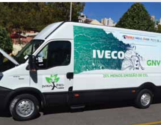
Uma das Vans usadas no projeto