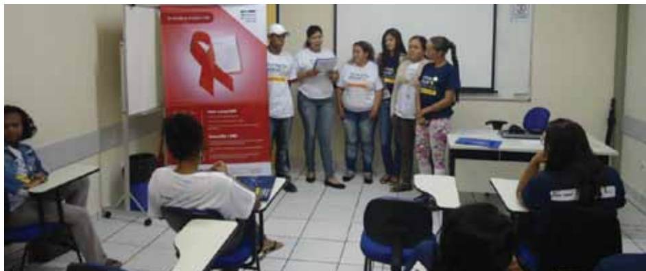
Exibição de filme e palestras educativas como forma de orientar os alunos de Lavras

Em Sete Lagoas, foram realizadas palestras sobre Aids e DSTs, distribuição de preservativos e dicas de saúde.