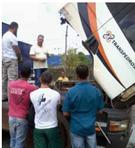
Alunos em aula prática com a carreta cedida