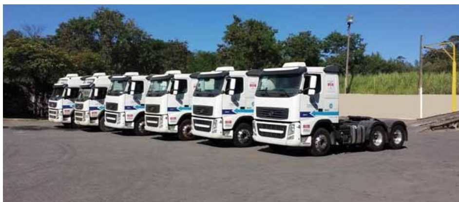
Novos caminhões que vão atender à Gerdau já foram entregues. Substituição começou em janeiro