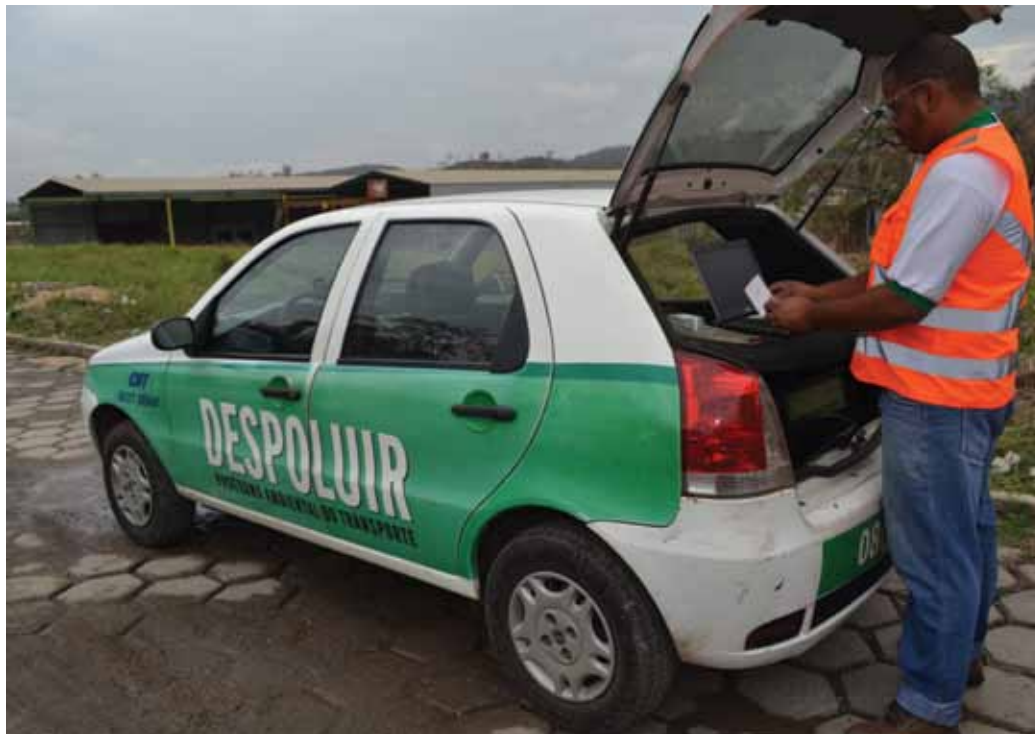
Despoluir: Quase 9 mil testes realizados em 2013, com mais de 95% de aprovação

Em todos os testes realizados os motoristas e empresários são informados do resultado na mesma hora. O veículo que estiver de acordo com os padrões estabelecidos pelo Conselho Nacional do Meio Ambiente (Conama) recebe o Selo Verde Despoluir. Caso contrário, ele passa por uma revisão para que um novo teste seja realizado pelos técnicos do programa.