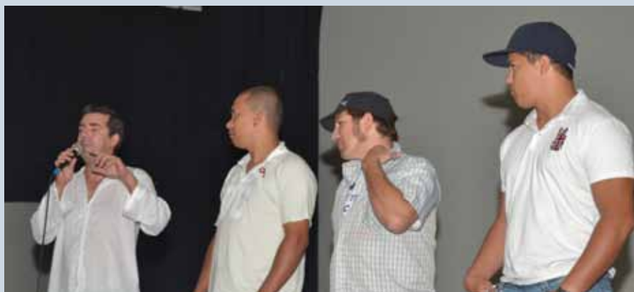
Grupo Repel levou colaboradores, clientes e fornecedores para a discussão sobre Aids e o trabalho