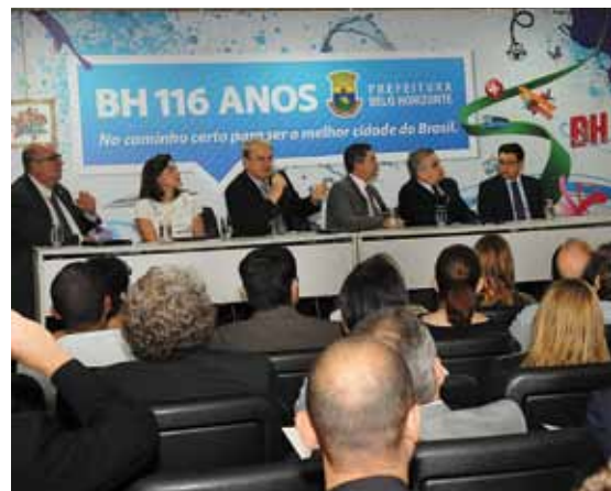
Posse do Comurb na Prefeitura de Belo Horizonte

O Comurb é composto por 47 membros titulares, sendo 11 repre-