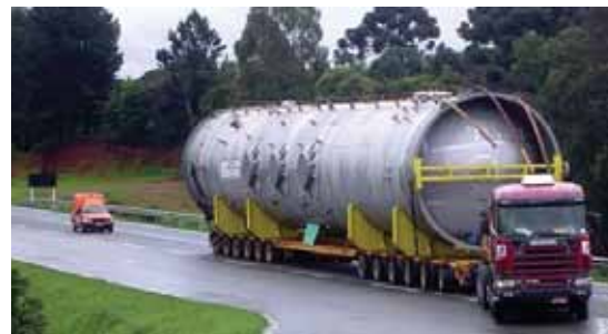
Cargas com grandes dimensões e elevado peso

A unidade de Contagem também está com as inscrições abertas para capacitação a ser realizada nos dias 17 a 21 de março para motoristas que não possuem nenhum curso da Resolução 168/Contran. De 15 a 16 de março, a unidade oferece curso de aproveitamento para motoristas que já possuem pelo menos um curso da Resolução 168/Contran e atualização, de 22 a 23 de março, para motoristas que já possuem o curso de