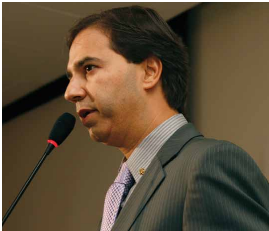
Para Sérgio Pedrosa, estratégias de mobilidade usadas durante a Copa das Confederações devem ser reavaliadas

São considerados produtos perigosos os materiais, substâncias ou artefatos que possam acarretar riscos à saúde humana e animal, bem como prejuízos materiais e danos ao meio ambiente.