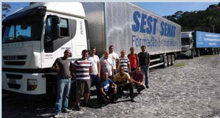
Alunos à frente da nova carreta Iveco, utilizada para o treinamento prático na unidade Serra Verde

Para informações sobre as datas de realização deste, e de outros cursos, entre em contato com a unidade pelo telefone (31) 3408-1512. ■