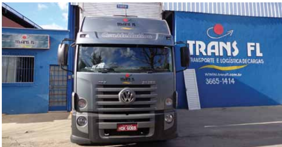
Ao completar 10 anos de mercado, a Trans FL se prepara para atender outros segmentos, como o de mineração

Após cinco anos de mercado, a Trans FL já contava com frota própria. O crescimento da empresa foi impulsionado pelos investimentos e novas oportunidades no Vetor Norte de Belo Horizonte, com a migração de grandes indústrias para a região. Ela tem sede em Pedro Leopoldo, possui 20 veículos próprios na cidade